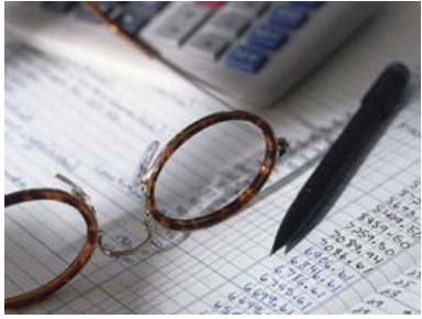
El aumento de la confianza de los empresarios aumentó un 14% respecto a la encuesta anterior.

◦ Otros países de América Latina se encuentran muy por encima de las expectativas mexicanas Encuesta revela que 35% de los empresarios mexicanos considera que el financiamiento será más accesible este año